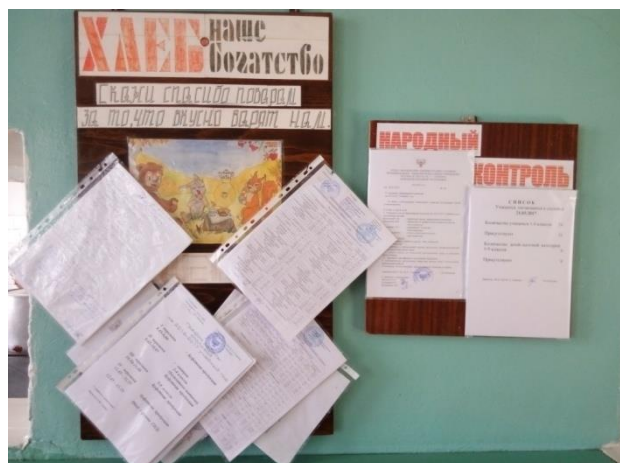
График питания в школьной столовой разработан на основании расписания занятий, утвержден директором школы и вывешен рядом с меню. На пищеблоке работает один повар – Орел Валентина Владимировна. Стаж работы на должности в данной школе менее 2 года, имеет специальное образование. Имеет 4 разряд.

Общее количество питающихся учащихся составляет 33 , что составляет 50 % от общего количества учащихся. Всего в школе питаются, от общего количества учащихся 1-9 классов - 50 %. 50 % учащихся не охвачены горячим питанием.